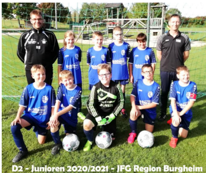
D2 - Junioren 2020/2021 - JFG Region Burgheim

Ausgabe 11 – Saison 2019/2020 – 11.10.2020