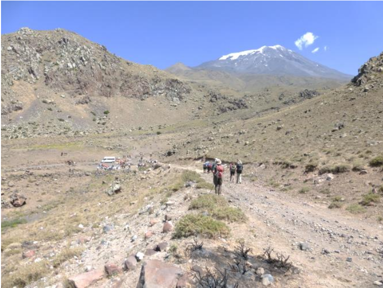
Zurück am Ausgangspunkt auf 2200 m. Ararat im Hintergrund.