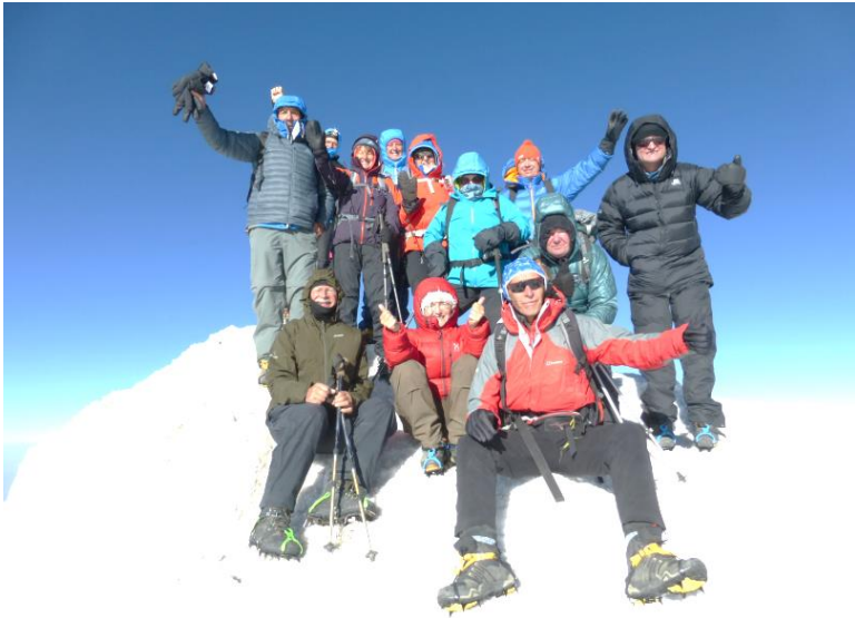
Die Gruppe auf dem Gipfel auf 5165 m. Es gibt nicht viel Platz