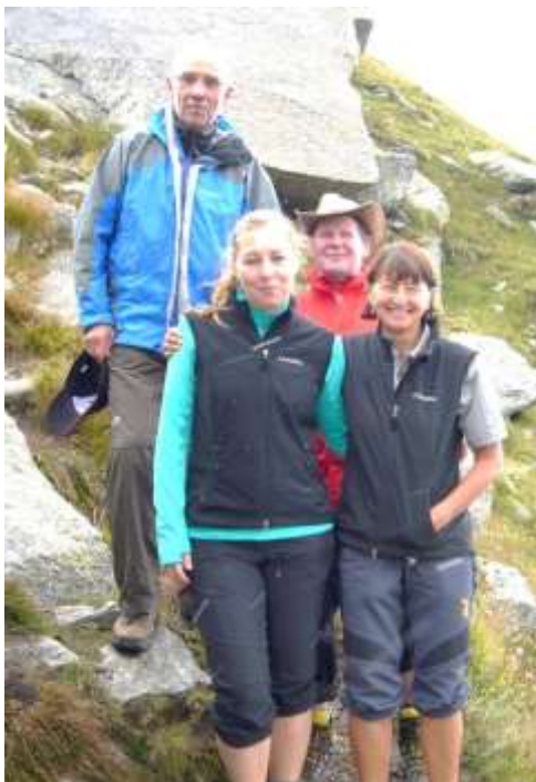
Auf der Hochgangscharte

Württemberg in kurzer Hose. Zwei Stunden steiler Aufstieg standen vor uns. Vor allem das letzte Teilstück hatte es in sich. Fast senkrecht ging es nach oben. Die gespannten Seile gaben aber große Sicherheit. Manchmal auf allen Vieren ging es vorwärts. Für dieses Teilstück war absolute Schwindelfreiheit Voraussetzung. Gämsen und Steinböcke ästen selbst in den steilsten Hängen. Kurz vor Erreichen der Scharte setzte auch noch leichter Schneefall ein. Nach zwei Stunden war es geschafft und wir hatten eine Pause redlich verdient.