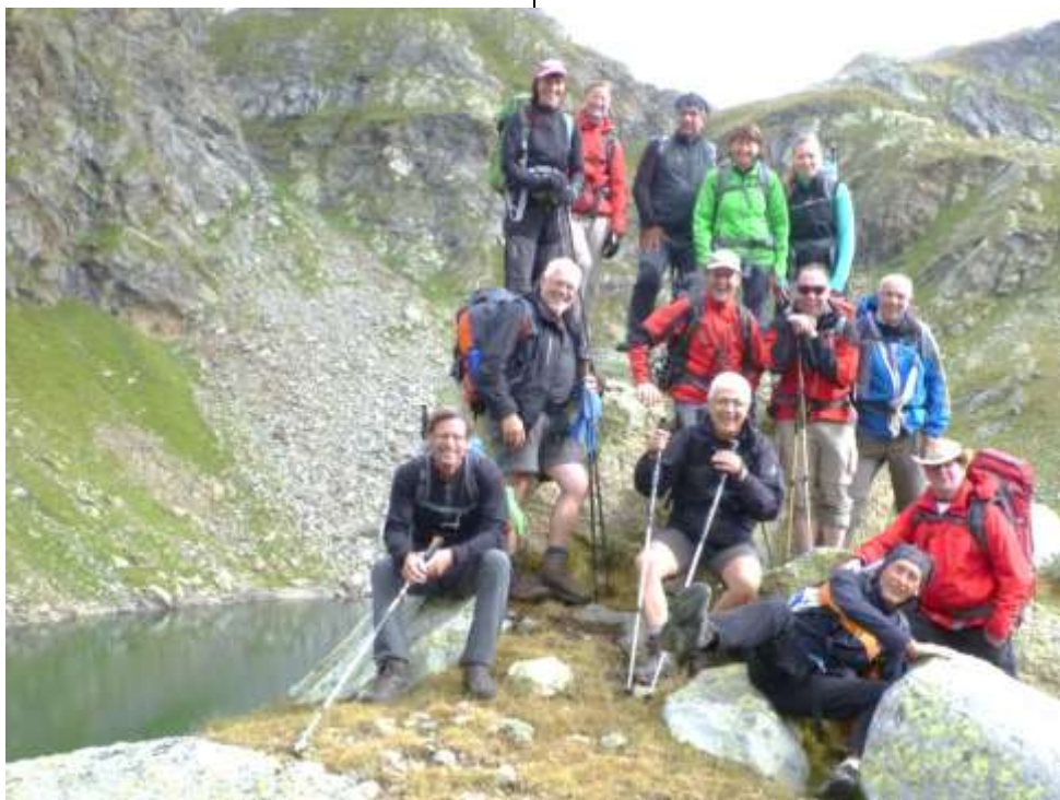
Gruppenbild auf dem Hochplateau der Spronser Seen

Hunderte von Ziegen kamen uns entgegen. Auch mehrere Wanderer in nicht bester Ausrüstung stiegen Richtung Oberkaser. Man merkte, der Weg zur Bergstation Hochmuth ist nicht mehr sehr weit. Die Aussicht nach Meran, Bozen und den Dolomiten traumhaft. Nur der Wanderweg mit quer aufgestellten Steinplatten war sehr gewöhnungsbedürftig.