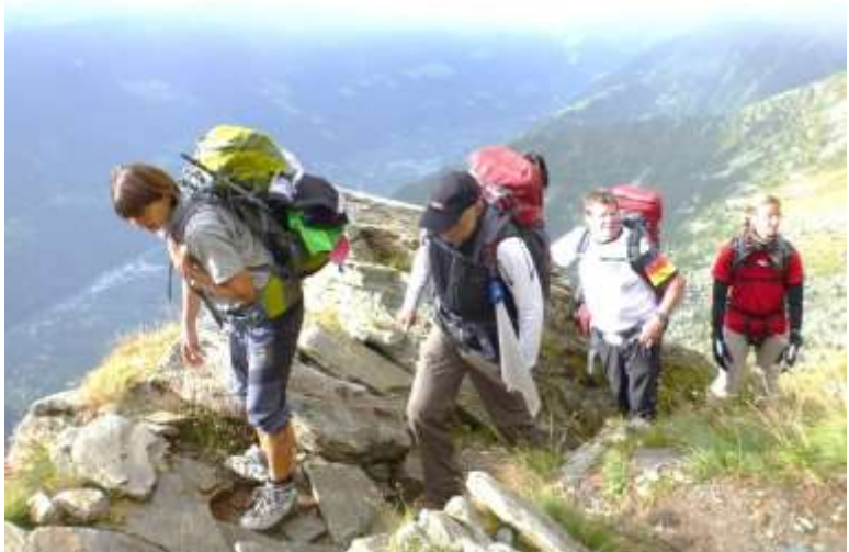
Aufstieg zur Hochgangscharte

Kurz vor 08 Uhr stand die Gruppe abmarschbereit vor der Hütte.